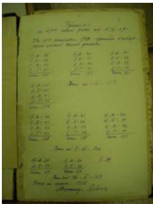
Приказ № 1 (состав классов на 1939 уч. год)

За последние годы был существенно пополнен музейный фонд материалами по истории школы. Ребята работали в Объединенном архиве учреждений системы образования, где нашли множество интересных документов.